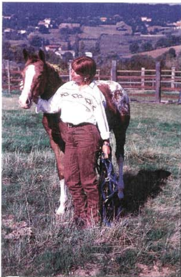
Une robe, une ligne, mais également un caractère doux font de l'appaloosa le cheval de la famille