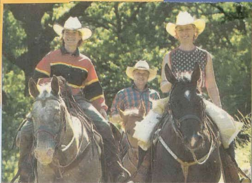
Une façon de monter adaptée aux randonnées.