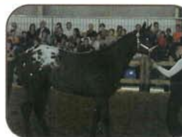
Shesadream Sigodière : Médaille d'Argent Yearling N. pro Médaille de Bronze Yearling Open Médaille d'Argent Yearling Longe Line Opé