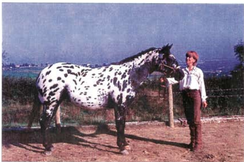
L'appaloosa embellit de saison en saison, dans son modèle, mais également dans la définition de sa robe (élevage de la Sigodière).