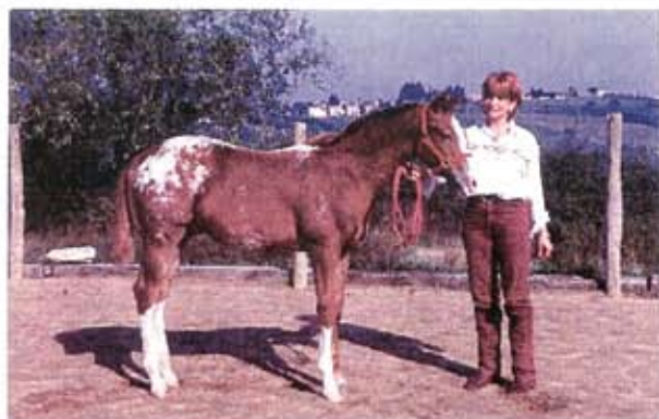
Les poulains appaloosas ont aujourd'hui une morphologie moins rustique (élevage de la Sigodière).