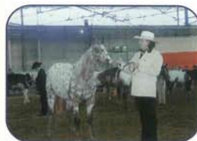
Elusive La Sigodière : Médaille d'Or Yearling Longe Line N. pro